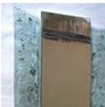
Praca nr 34

Lustro szkło+ blacha, 2006 rok, 50x75 cm, szkło wypalane w piecu w temp. 820 st. C