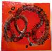
Praca nr 31

Czerwona patela z czarnym malowanym wzorem, 2009 rok, wielkość 50x50cm.