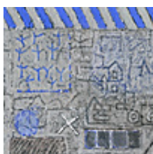
Praca nr 50

Mini3, technika mieszana, 10x10cm, 2008 rok