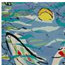
Praca nr 23