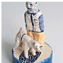
Praca nr 44