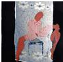
Praca nr 41