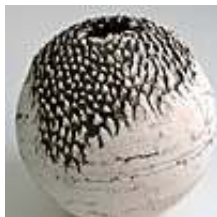
Praca nr 46