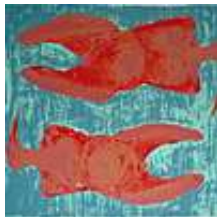
Praca nr 40