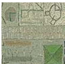
Praca nr 52

Bez tytułu, olej na płótnie, 20x20cm, 2005 rok