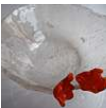
Praca nr 33

Misa na owoce, bezbarwna z kwiatkami, 2010 rok, śr. 35 cm, szkło sodowe wypalane w piecu w temp. 800 st. C