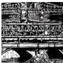
Praca nr 20