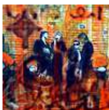
Praca nr 10

Ploty, akryl, highlighter na płótnie, 89x169 cm, 2008 rok.