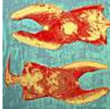
Praca nr 38