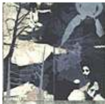
Praca nr 6

I gave you the Childhood, technika mieszana-polimer wodny, intaglio, 170x100 mm, 2008 rok.