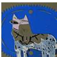
Praca nr 25