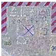
Praca nr 48

Mini4, technika mieszana, 10x10cm, 2008 rok