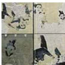
Praca nr 9

Children - Fishes, technika mieszana-polimer wodny, intaglio, 175x180 mm, 2003 rok.