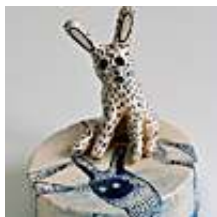
Praca nr 45