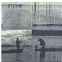
Praca nr 8

Sailing until the End, technika mieszana-polimer wodny, intaglio, 170x130 mm, 2008 rok