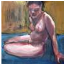
Praca nr 39