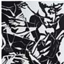
Praca nr 37