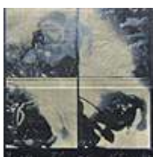
Praca nr 7

Depth, technika mieszana-polimer wodny, intaglio, 175x180 mm, 2003 rok.