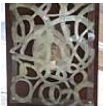
Praca nr 32

Lampa ozdobna "Kinkiet", 2010 rok, 50x80 cm, drewno+szkło