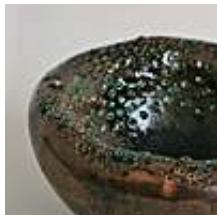
Praca nr 43