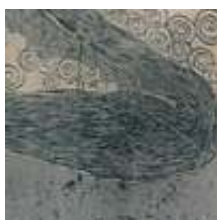
Praca nr 11

Nebieskie migdały, linoryt, 70x50cm, rok 1999