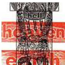
Praca nr 17