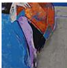
Praca nr 53

"Ona" , wymiary 80x80cm, technika akryl na płótnie, sygnowany.