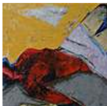
Praca nr 54

"Bezwład cielesności", wymiary 85x140 cm, olej na płótnie, akryl na płótnie, sygnowany.