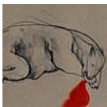
Praca nr 3

Długopis na papierze, cienkopis na szkle i ramie, papier / oprawiony, format 24x32 cm - rok 2010.