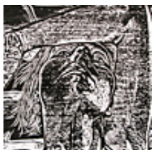
Praca nr 18