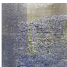
Praca nr 15