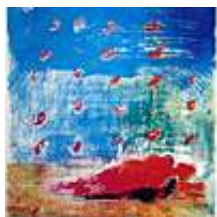
Praca nr 42