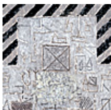
Praca nr 49

Mini2, technika mieszana, 10x10cm, 2008 rok