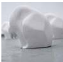
Praca nr 4

Miś, gips zaimpregnowany, format - 17x20x12 cm