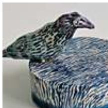
Praca nr 47