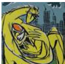
Praca nr 22