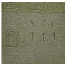
Praca nr 51

Bez tytułu, olej na płótnie, 41x33cm, 1998 rok