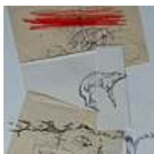
Praca nr 5

Długopis, piórko na papierze, cienkopisy oraz kredka na szkle / oprawione w ramę 30x40cm - 2010 rok