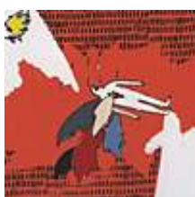
Praca nr 2

Martwiak, sitodruk kolor, format b5, oprawiony w ramkę o formacie 30x40cm, 2009 rok.