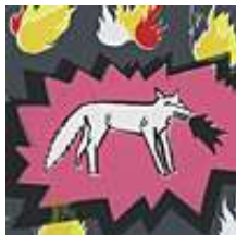
Praca nr 1

Firefox, sitodruk kolor, format b5, oprawiony w ramkę o formacie 30x40 cm, 2009 rok.