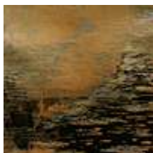
Praca nr 12