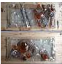
Praca nr 35

Obrazki x2, 2010 rok, szkło + drewno, szkło barwione wypalane w piecu w temp. 820 st. C, mogą być podświetlone diodami