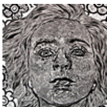
Praca nr 19