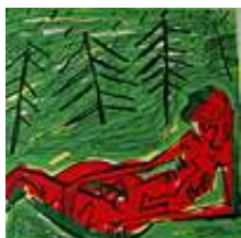
Praca nr 24