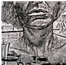
Praca nr 16