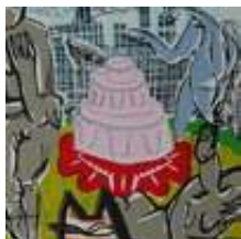
Praca nr 21